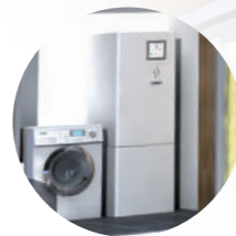
2. Unité intérieure Yutaki S80 et S80 Combi