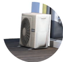
1. Unité extérieure