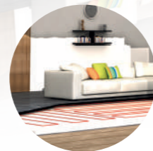
3. S'adapte bien avec vos radiateurs que vos planchers chauffants