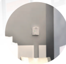
4. Télécommande radio